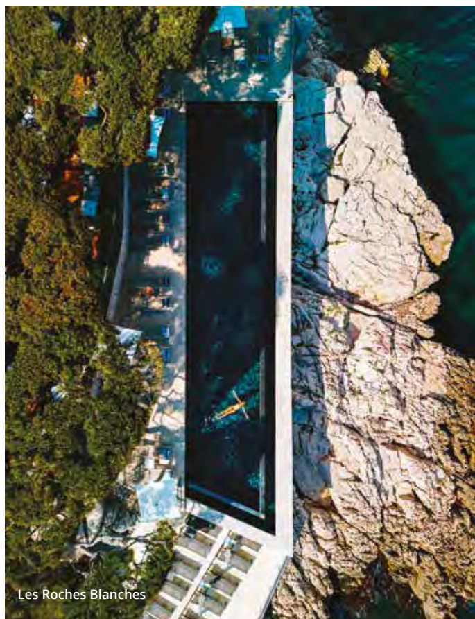
Les Roches Blanches