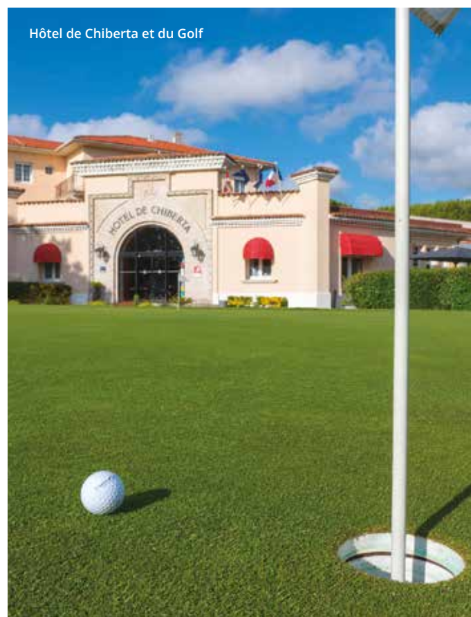
Hôtel de Chiberta et du Golf