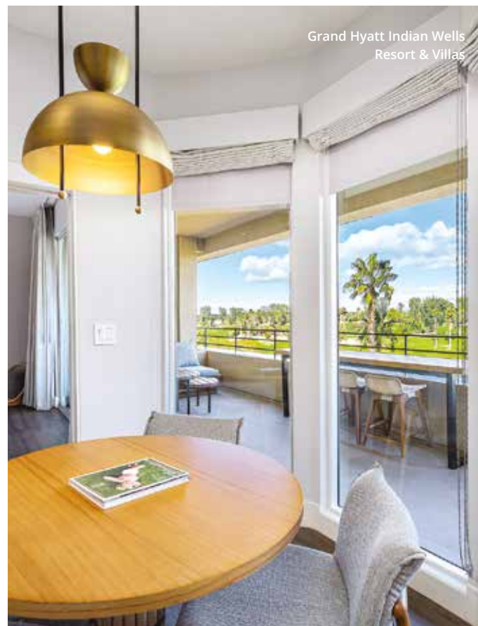
Grand Hyatt Indian Wells Resort & Villas