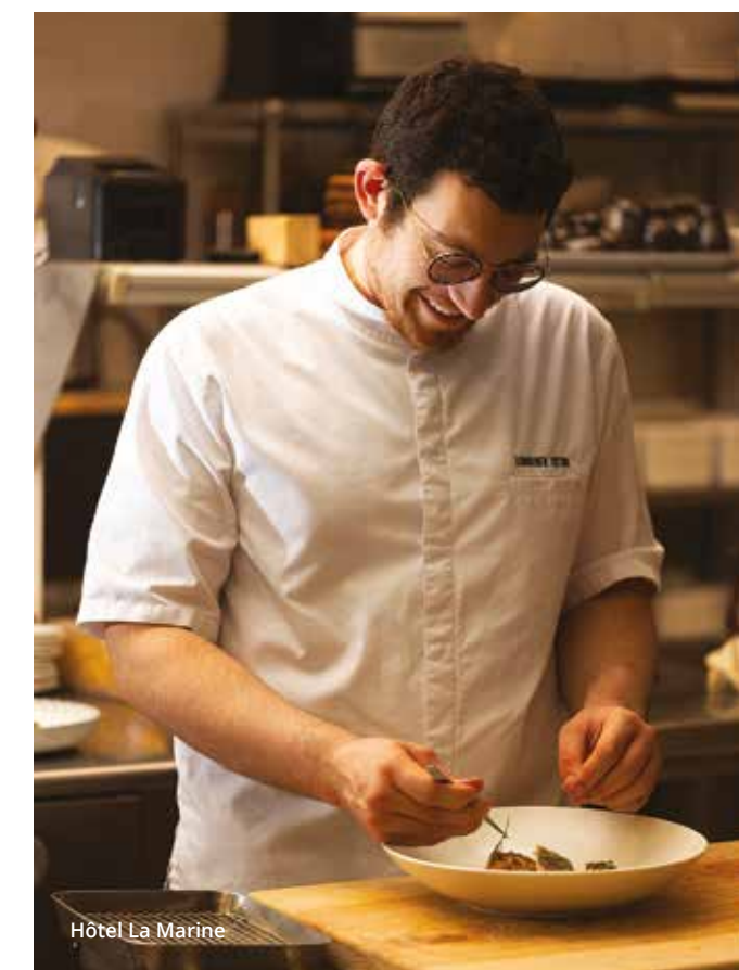
Hôtel La Marine