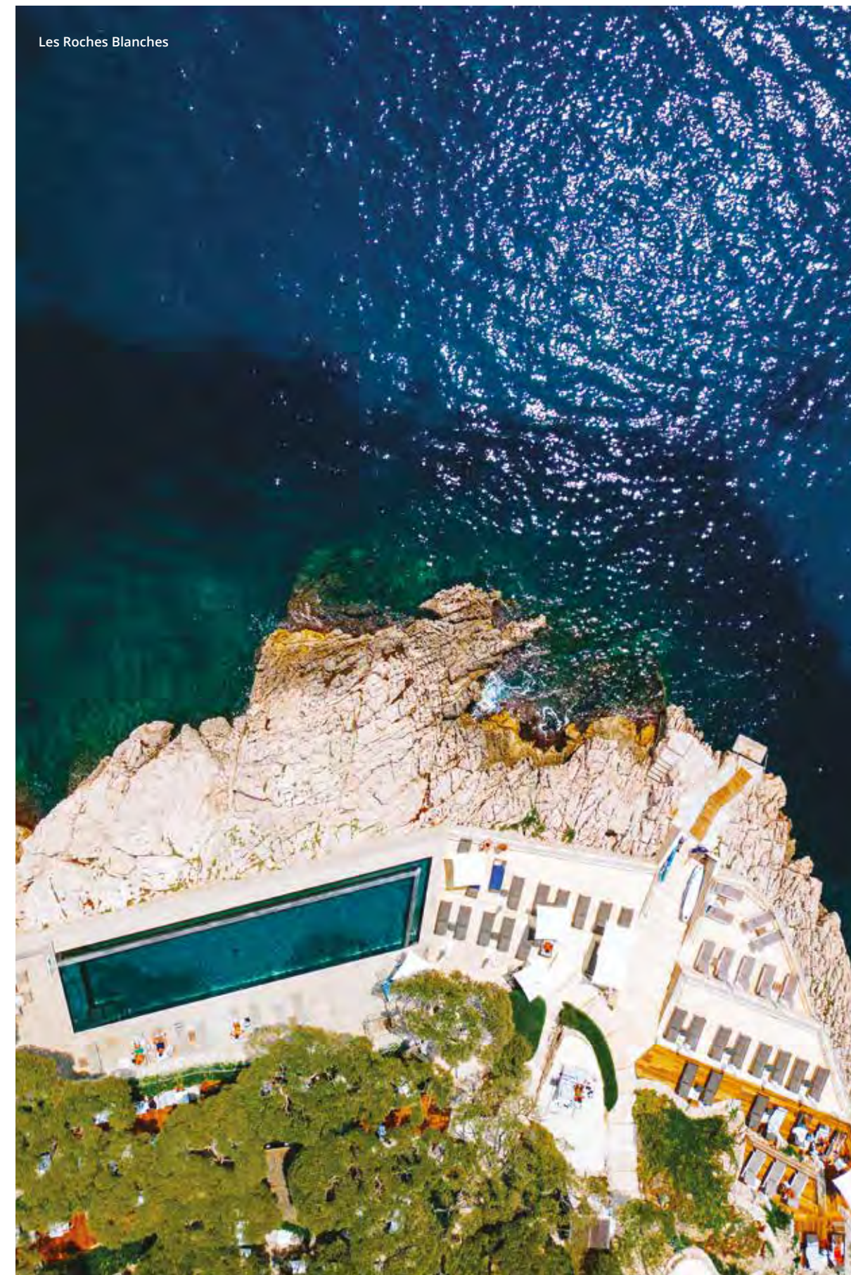
Les Roches Blanches