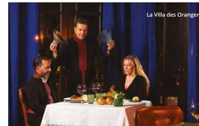
La Villa des Orangers

Chambre double à partir de 119 €. hotelmarine.com