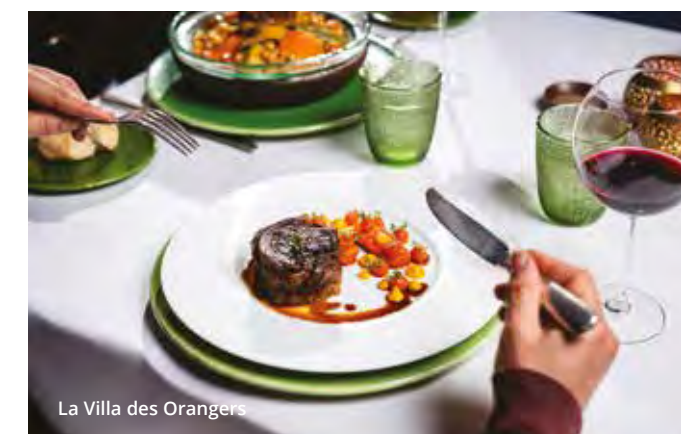
La Villa des Orangers